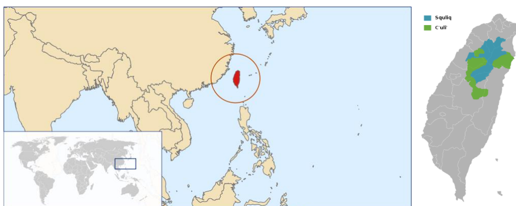
Рис.1 Зона распространения атаяльского языка